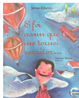
E foi assim que me tornei escritor... Autor: Jonas Ribeiro Editora: Elementar