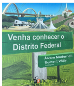
Venha conhecer o Distrito Federal Autores: Álvaro Modernell e Ramon Willy Editora: Mais Amigos