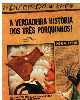
A verdadeira história dos três porquinhos - Autor: Jon Scieszka Editora: Companhia das letrinhas