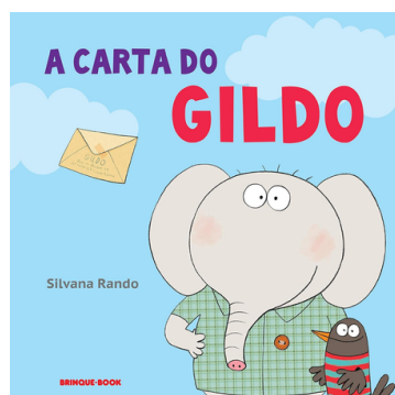
A carta do Gildo - Autora: Silvana Rando Editora: Brinque-Book