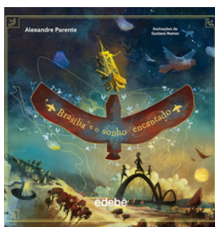
Brasília e o Sonho Encantado – Autor: Alexandre Parente – Editora: EDEBE BRASIL